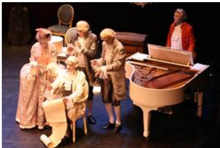
Le Directeur de théâtre, Mozart/Salieri 06/12/08 au Jeu de Paume