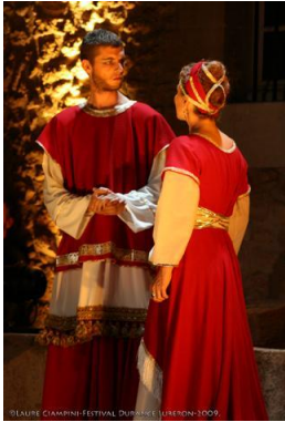
Athalie, Château de Mirabeau, Août 2009