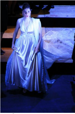
Opéra d'opérette, Mai 2009