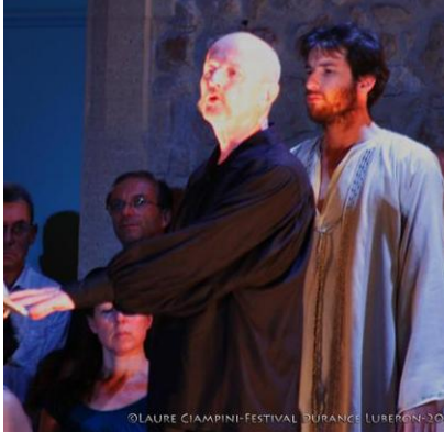
Athalie, Château de Mirabeau été 2009