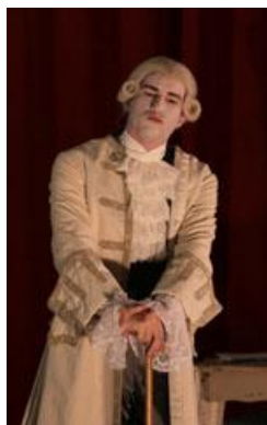
Le Directeur de Théâtre, Mozart /Salieri théâtre du Jeu de Paume Aix en Provence , Décembre 2008

Comédien issu du conservatoire de Grenoble et titulaire d'une Maîtrise d'Etudes Théâtrales obtenue à l'université d'Aix en Provence, il aborde le théâtre de répertoire (Les Fourberies de Scapin, Les Précieuses Ridicules, L'Impromptu de Versailles de Molière Maman Saboulex de Labiche, L'Arlésienne de Daudet et Bizet avec Orchestre Symphonique), mais aussi le répertoire contemporain (The Woman d'Edward Bond, théâtre Vitez d'Aix en Provence) et le café-théâtre (Diablogues de Dubillard).